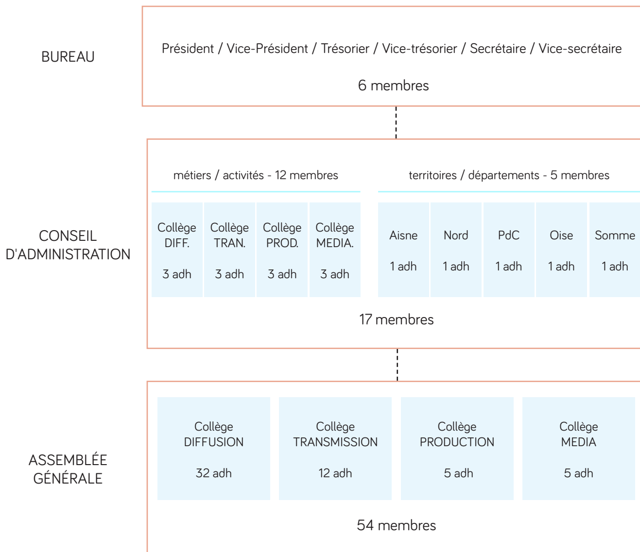
Schéma de gouvernance

Dans un souci de représentativité de la filière en région, le pôle régional déploiera en 2019 une politique d'adhésion prenant en compte les équilibres territoriaux et sectoriels (activités ou territoires sous-représentés). Les demandes d'adhésion se font en ligne via un formulaire, qui sera simplifié en 2019, en permet-